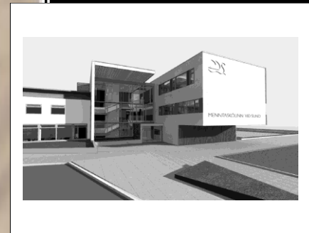
Menntaskólinn við Sund