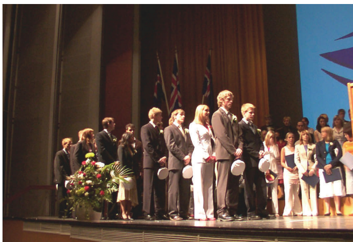
Mynd . Frá brautskráningu stúdenta í Háskólabíói vorið 2003.

Stærð hópa sem útskrifast ræðst ekki eingöngu af fjölda nemenda sem innritast fjórum árum áður heldur getur mismikið brottfall og misjafnt námsgengi haft þar áhrif. Velta má því fyrir sér hvort átök á launamarkaði hafi ekki neikvæð áhrif á skólagöngu framhaldsskólanema. Ætla má að áhrifin verði mest á yngsta hluta nemenda sem ekki hefur tamið sér sjálfstæði í vinnubrögðum þegar átök hefjast. Um þetta eru að minnsta kosti ákveðnar vísbendingar í gögnum skólans t.d. þegar fjöldi brautskráðra stúdenta er skoðaður með tilliti til fjölda innritaðra nemenda á fyrsta ár fjórum árum áður. Það hlýtur því að vera eitt af mikilvægustu baráttumálum menntamálaráðherra hverju sinni að gera sitt til þess að kjör kennara séu þannig að ekki þurfi að koma til átaka og verkfalla.